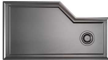
Fregadero Diade Gun Metal Fumè 3028 816